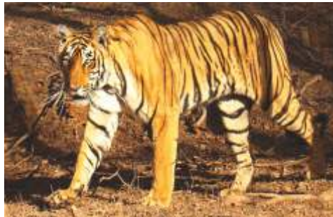
राष्ट्रीय पशु- बाघ