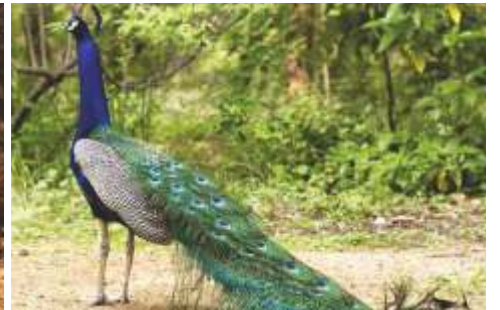
राष्ट्रीय पक्षी- मोर