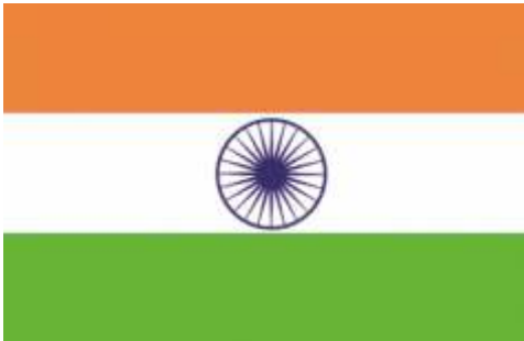
राष्ट्रीय झंडा- तिरंगा